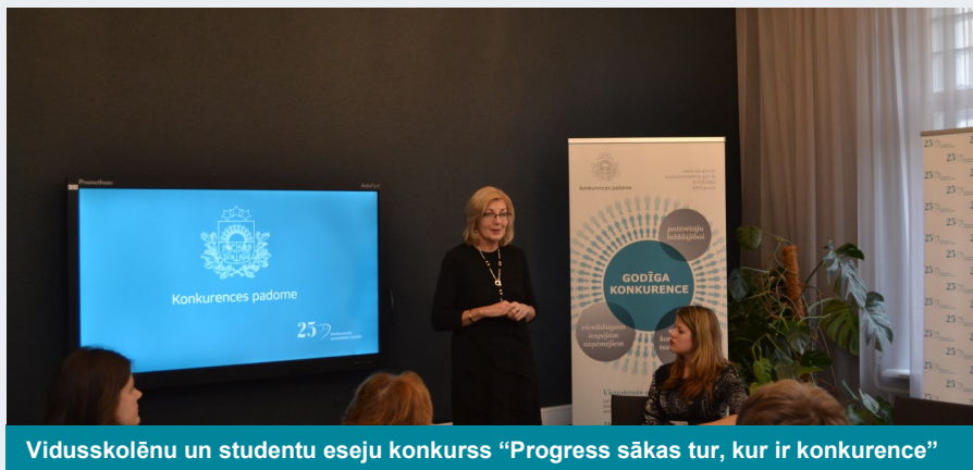
Vidusskolēnu un studentu eseju konkurss "Progress sākas tur, kur ir konkurence"