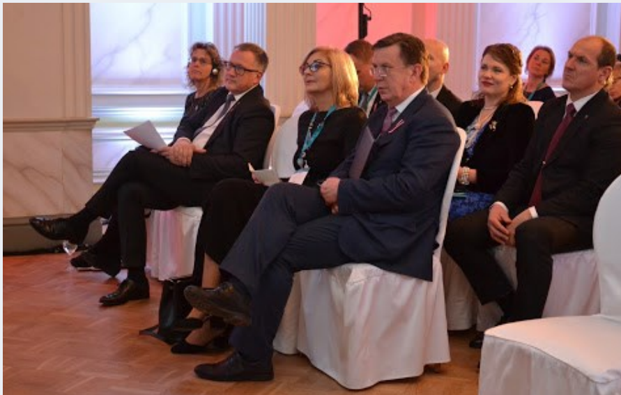
Konferences moto—„Progress sākas tur, kur ir konkurence”.