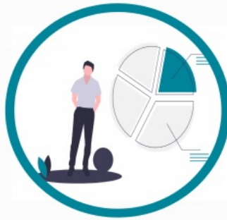
vienošanās par tirgus sadali