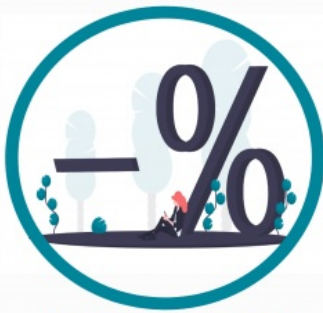
vienošanās par cenu

Uzturot pārlietu ciešas attiecības ar konkurentiem, uzņēmumam ir risks iesaistīties aizliegtā vienošanās jeb kartelī , kas ir smagākais konkurences tiesību pārkāpums. Ar šī saraksta palīdzību pārlicinies, vai Tava un uzņēmuma darbinieku ikdienas rīcība nepārkāpj likumu un uzņēmums nav kļuvis par karteļa dalībnieku.