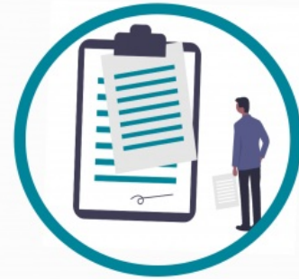
vienošanās par dalību iepirkumos